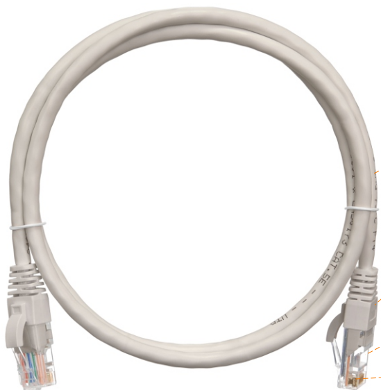
NMC-PC4UD55B- xxx -C- zz

Шнуры изготавливаются с оболочками 7 разных цветов и длинами от 0,15 до 20 метров. Поставляются в индивидуальных полиэтиленовых пакетах, дополнительно объединенных в групповые упаковки по 10 штук.